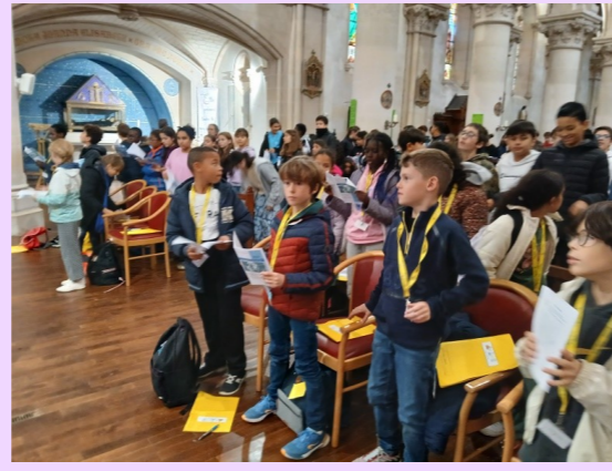
Les délégués de CM1 et CM2

Nous avons fait beaucoup de découvertes sur la fondation de notre école Notre Dame et de belles rencontres avec les délégués CM1/CM2 de l'école St Louis de Bonnières.