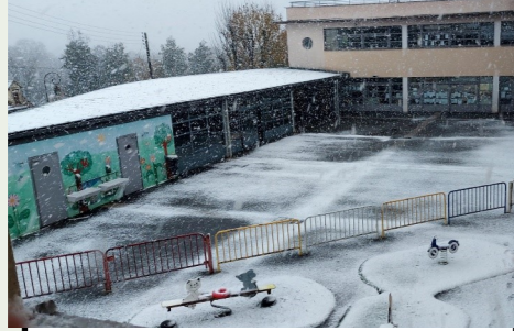
Les 21 et 22 novembre derniers : joie de la première neige à l'école !

BLANC BONHOMME BOULE DEGEL ECHARPE FLOCON FONDRE FROID GANTS GELÉ